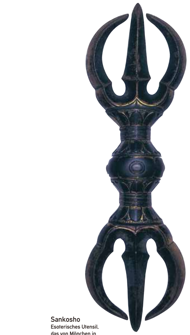
Sankosho Esoterisches Utensil, das von Mönchen in buddhistischen Messen verwendet wird.

Die Shukubo-Vereinigung bietet einen Verleih von Audioguides an, mit denen Sie die Führung in Japanisch, Englisch, Französisch, Mandarin und Koreanisch genießen können.